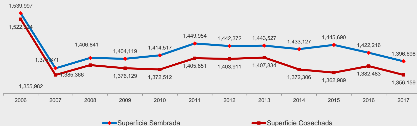
Chiapas Superficie Sembrada y Cosechada Anual (Hectáreas)

Si desea consultar el archivo con datos sobre cultivos desde el año 2012, haga click aquí